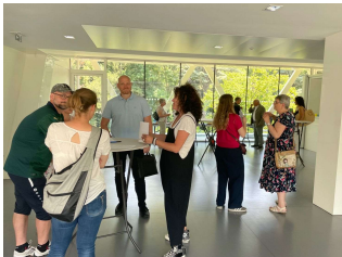
Hayange - juin