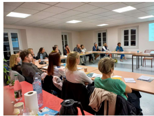
Contrexéville - octobre