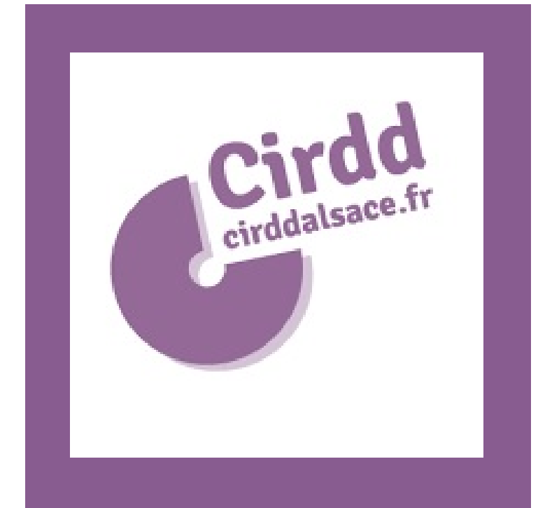
L'équipe du CIRDD ALSACE